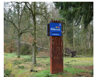
Kempenbroek Onthaalpunt in de Schakel

11 juli om 18.00 uur; 25 juli om 12.00 uur